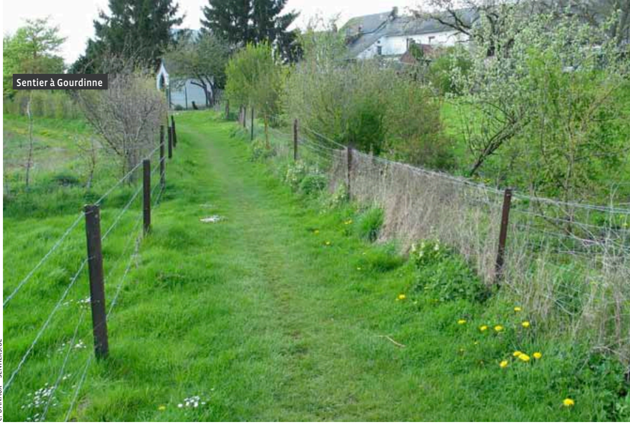
Sentier à Gourdinne