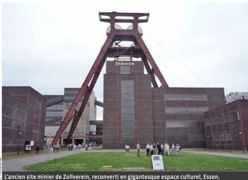
L'ancien site minier de Zollverein, reconverti en gigantesque espace culturel, Essen.

Le patrimoine donne du sens à une collectivité, et contient donc une dimension stratégique importante. À ce titre sa protection représente un enjeu de premier plan. Les pouvoirs publics doivent se montrer concernés à son endroit. Subsidés divers à la restauration constituent des leviers mobilisables, mais il y en a d'autres. Seuls comptent au final l'état de bonne conservation du bien et son fonctionnement avec son environnement bâti. L'intérêt patrimonial d'un bien dépendra d'ailleurs souvent de son environnement, rural ou urbain. Leurs relations donneront sens au bien bâti, d'où l'intérêt premier de protéger tout autant le bien que le site.