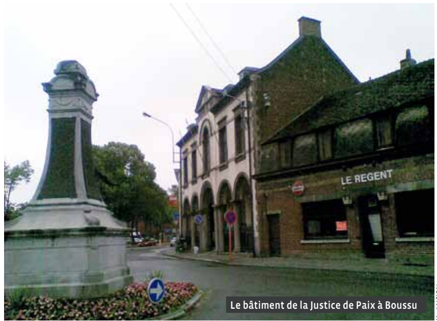
Le bâtiment de la Justice de Paix à Boussu

Dans la ville baroque européenne, le passage est un leitmotiv qui enchante les visiteurs de Vilnius, de Riga, de Prague, de Paris ou de l'île