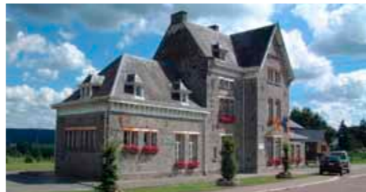
L'ancienne gare de Liernux accueille désormais le CPAS.

Source : Les petites gares : enjeux en termes de mobilité, d'accessibilité et de développement territorial, IEW, mars 2006, www.iewonline.be/spip.php?article307