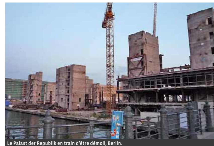
Le Palast der Republik en train d'être démolie, Berlin.

Ce qui est considéré comme patrimoine bâti est très fluctuant. Du