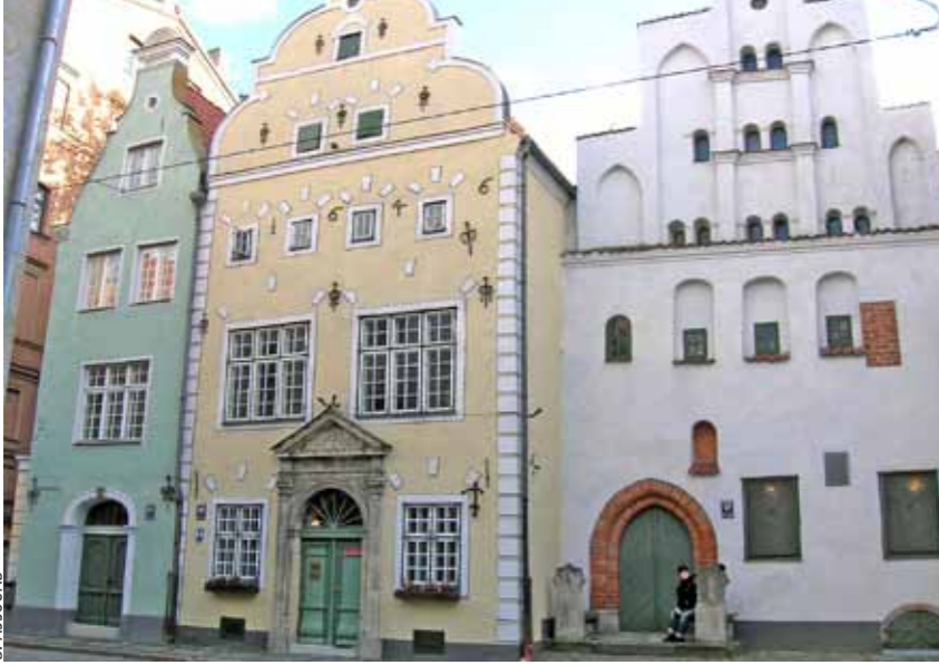
Les célèbres Trois Frères, en style hanséatique typique, Riga.

» Ces exemples interrogent notre idée du patrimoine bâti. Ils en remettent clairement en cause une définition purement artistique et architecturale.