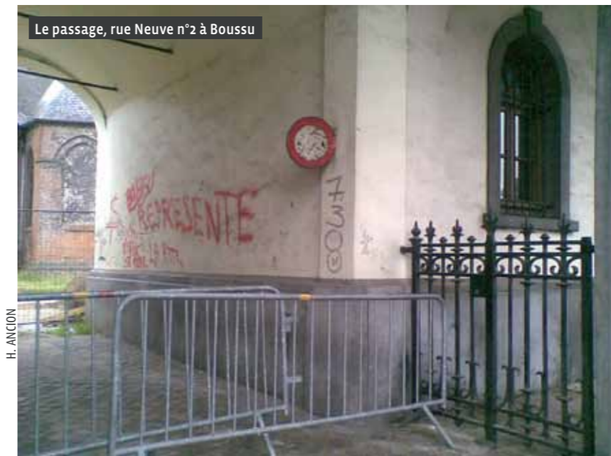
Le passage, rue Neuve n°2 à Boussu

Ignorante ou délibérément oublieuse de ses obligations en matière de servitude, la Régie des Bâtiments a également négligé les prescriptions d'un Plan Communal d'Aménagement, le PCA 70-II, lequel stipule pourtant la double affectation par des hachures bicolores. Chaque couleur est commentée dans les prescriptions écrites : le bleu correspond à une fonction publique non déterminée (justice de paix, par exemple) et le jaune à un passage public exclusivement réservé aux piétons. Les couleurs de la légende de tout PCA étant censées ne présenter aucune ambiguïté, le choix du hachurage témoigne de l'absolue nécessité de faire cohabiter deux fonctions qui doivent s'entendre, et non s'exclure. Le Plan communal de Boussu n'exprime donc pas la possibilité d'un choix, il redit, selon les conventions de la planologie wallonne moderne, une cohabitation qu'il faut maintenir, en l'occurrence une servitude à »